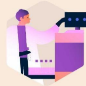
Aansluiten nieuwe labs