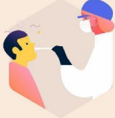
Verleggen van GGD-teststromen